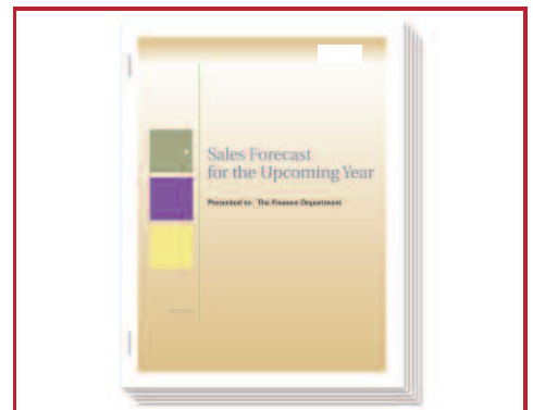
Finalize seus documentos da forma que desejar, usando uma ampla gama de recursos de acabamento. Por exemplo, adicione uma capa colorida em documento em preto e branco.