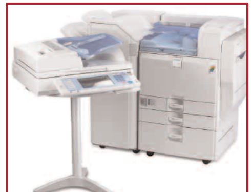
Uma opção separável de escâner dá ao sistema um perfil mais discreto e torna o painel de operação ainda mais acessível.