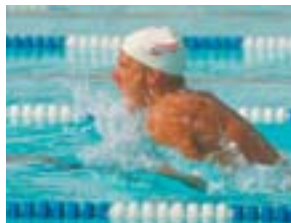
Sem a tecnologia HD Color

Os modelos da Série C710 equipados com o disco rígido 1 possuem recursos avançados de segurança, entre eles: