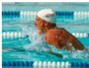
Com a tecnologia HD Color